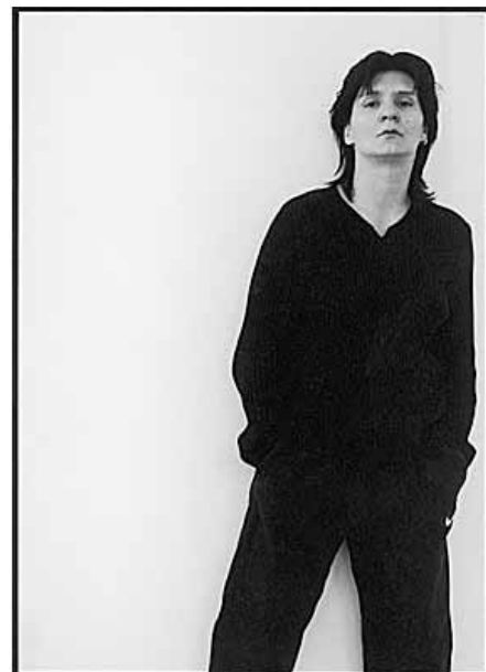
Eine der Fotografien von Eva Haule. Quelle: www.fotohof.or.at

Den Artikel finden Sie unter: http://www.jungewelt.de/2005/11-12/026.php