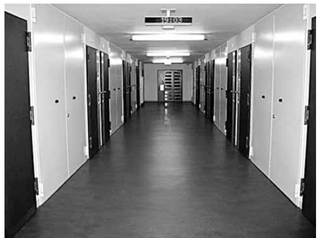
Oben: Zelle. Rechts: Gang