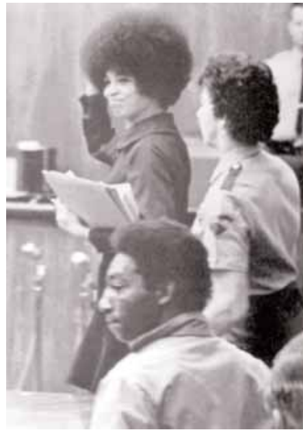
Angela Davis vor Gericht

„Es ist, als wäre das Gefängnis ebenso wie die Geburt oder der Tod eine unvermeidliche Lebensstatsache“, stellt Davis fest, doch aufgeben mag sie deswegen noch lange nicht. Am Ende entwirft sie Strategien zur Abschaffung des Gefängnisses. Ihr Gegenmodell beinhaltet ein „Justizsystem, das auf den Prinzipien Wiedergutmachung und Versöhnung beruht statt auf Vergeltung und Rache“, Bildungsprogramme, offene Grenzen, Sozial- und Gesundheitssysteme, die umsonst und für alle sind sowie die „ideologische Arbeit, die notwendig ist, um die begriffliche Verbindung zwischen Verbrechen und Strafe zu zerreißen“. Klar wird bei ihr auch, dass in besseren Zeiten das jetzige Gefängnisystem nicht einfach durch „ein einziges alternatives System der Bestrafung“ ersetzt werden kann.